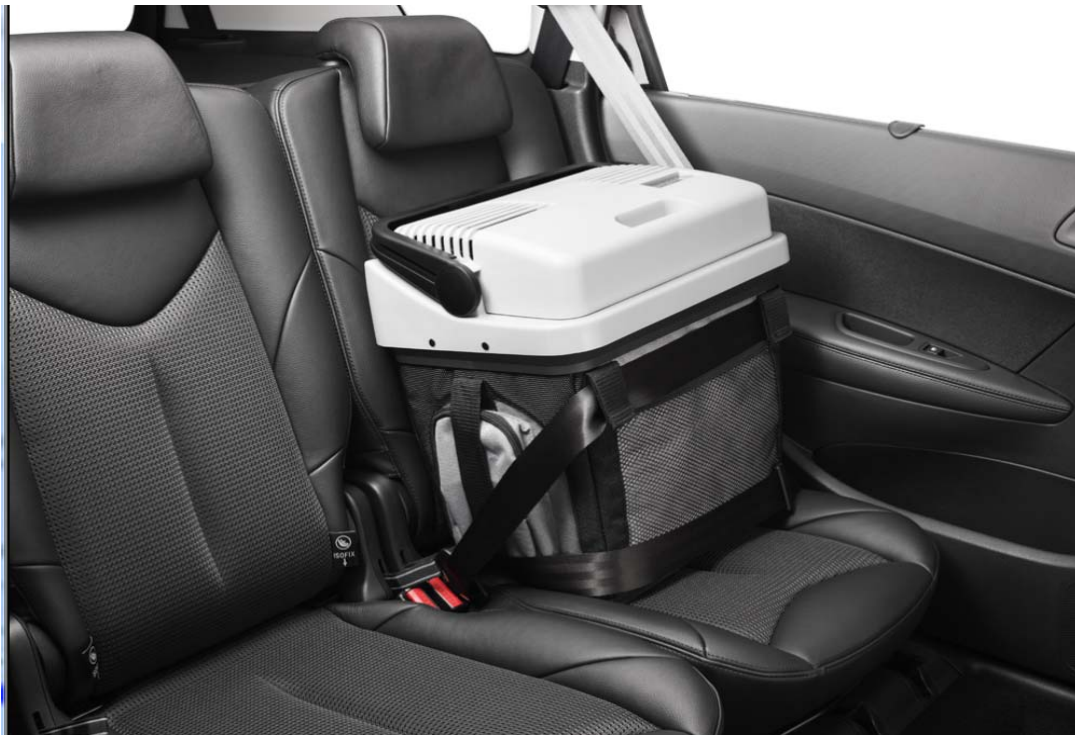
Module isotherme 24L WAECO (REF : 1607002980)

ACCESSOIRES POST USINE EN SERIE SUR VOTRE SERIE SPECIALE FAMILY