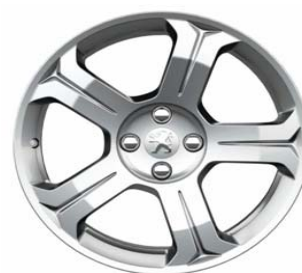
Jante alliage Licancabur 18"