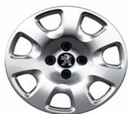
Enjoliveur Atacama 15"