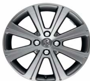
Jante alliage Melbourne 17"