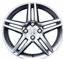
Jante alliage Stromboli 17"