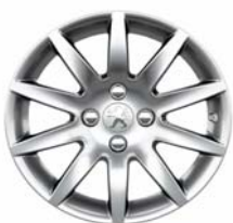
Jante alliage Izalco 16"