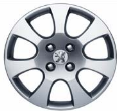
Enjoliveur Toliman 16"