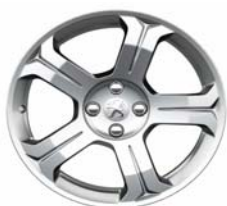
Jante alliage Licancabur 18"