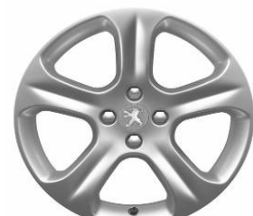
Jante alliage EXONA 18"