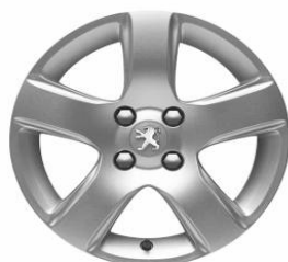
Jante alliage ISARA 16" (Uniquement avec option Grip Control)