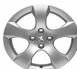
Jante alliage SAVARA 17"