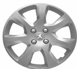
Enjoliveur ATAX 17"

Toutes les jantes de 3008 sont chaînables. Les jantes 17" et 18" sont chaînables avec jeux réduits.