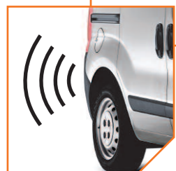
Radar de recul