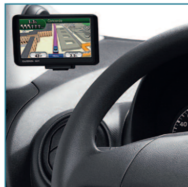
Modèle présenté : Bipper Pack GPS L1 avec options porte latérale coulissante et peinture métallisée.

VOLUME UTILE 2,8 m 3 ** CHARGE UTILE 610 kg LONGUEUR UTILE 2,5 m**