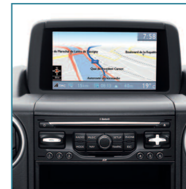
Modèle présenté : Partner Pack GPS L1 avec options porte latérale coulissante et peinture métallisée.