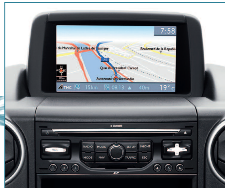
Navigation/Kit Mains Libres WIP Nav

Peugeot vous propose en exclusivité LA SÉRIE SPÉCIALE PACK GPS avec un maximum d'équipements pour toujours plus de confort et un meilleur soutien dans votre activité quotidienne.