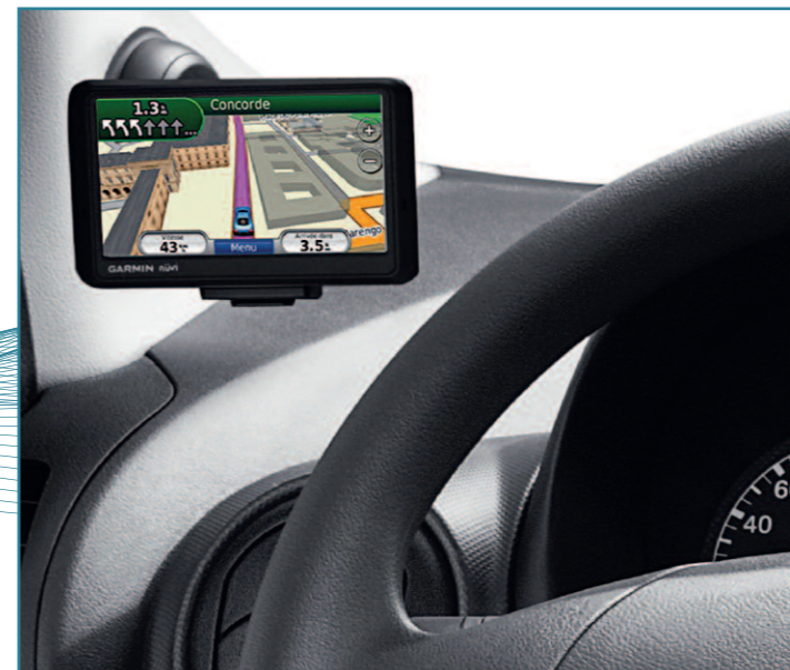
Navigation/Kit Mains Libres Garmin Nüvi 765

Pour les professionnels qui aiment aller à l'essentiel, Peugeot a choisi d'équiper le Partner et l'Expert du système de navigation WIP Nav entièrement intégré dans la console centrale, avec système audio et multimédia, pour vous apporter simplicité et confort.