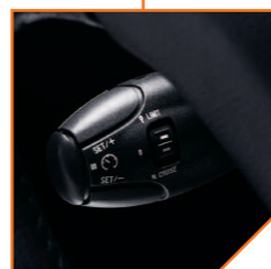
Régulateur de vitesse