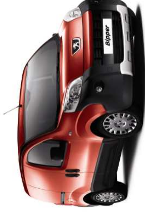
Version équipée de l'option Pack Chantier