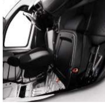
Siège passager dossier rabattu en position tablette

*En option. **En option, liée au siège passager escamotable.