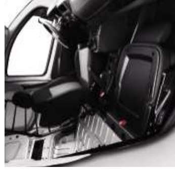
Siège escamotable libérant un espace supplémentaire