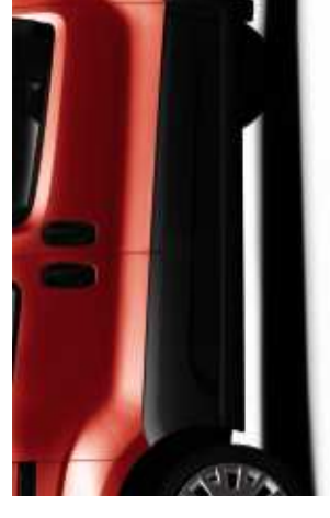
Protections latérales élargies