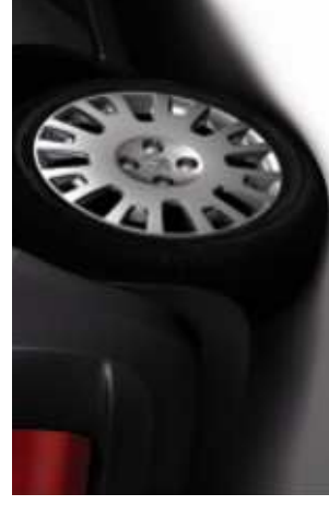
Bavette de style