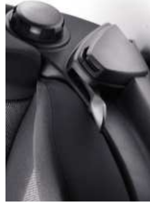
Réglage lombaire conducteur