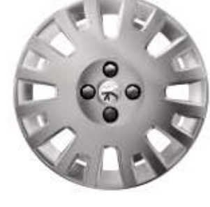
Enjoliveurs 15" Sketch