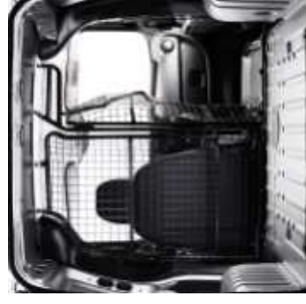
Cloison modulaire liée au siège passager escamotable**