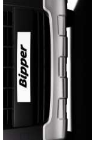
Protection sous moteur